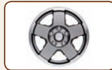
ALU VELGEN 7.5 X 17" MET 5 SPAKEN.