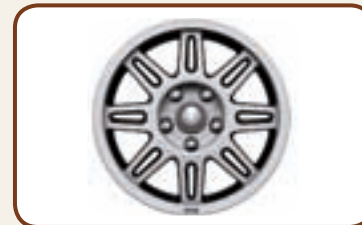
ALU VELGEN 7.5 X 17" MET 8 SPAKEN.