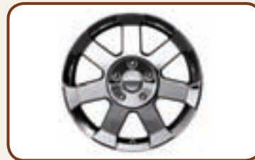
ALU VELGEN 7.5 X 18" MET 7 SPAKEN.