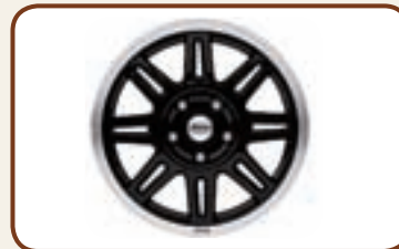
ALU VELGEN 7.5 X 17" MET 8 SPAKEN.