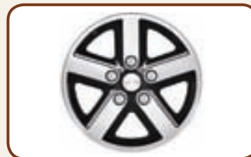
ALU VELGEN 7 X 16" MET 5 SPAKEN.