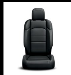
Sièges en cuir noir