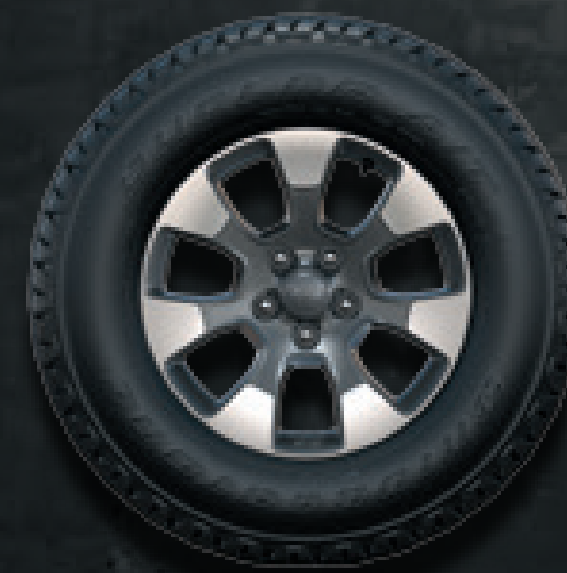
JANTES USINÉES 18" GRIS TECH Disponible sur Sahara avec Pack Overland