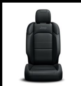
Sièges en cuir noir McKinley avec logo 'Overland'