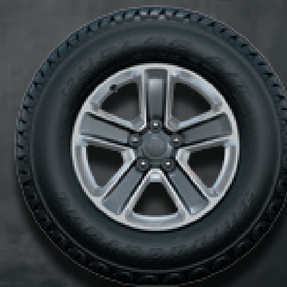
JANTES POLIES 18" AVEC RAYONS GRIS TECH De série sur Sahara