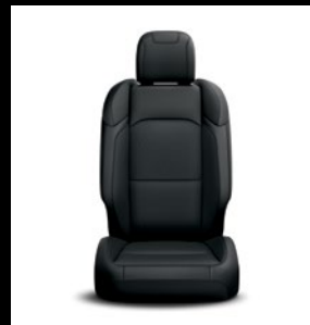
Sièges en tissu noir