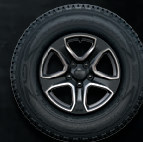
JANTES USINÉES 17" GRANITE CRYSTAL De série sur Sport