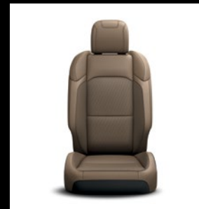
Sièges en tissu Heritage Tan