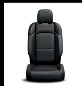
Sièges en cuir noir avec logo 'Rubicon'