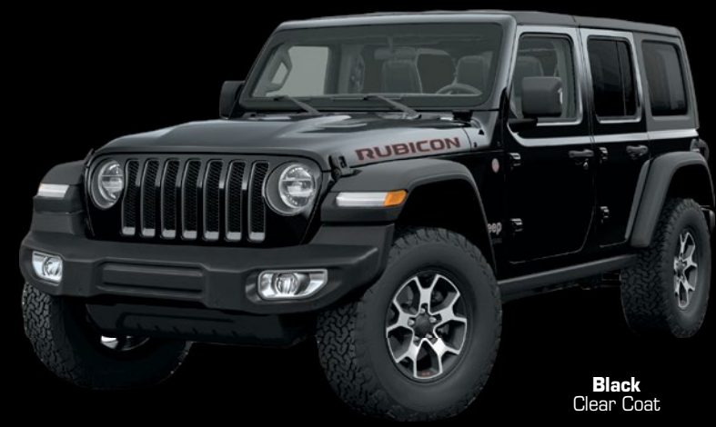
Black Clear Coat