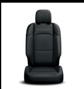
Sièges en tissu noir avec logo 'Sahara'