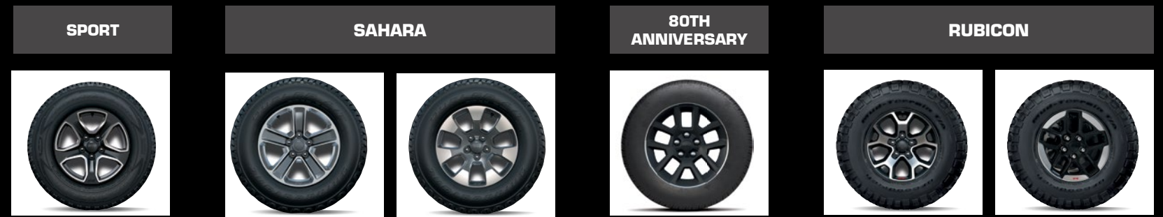
Jantes en aluminium 17" (de série : WGG )