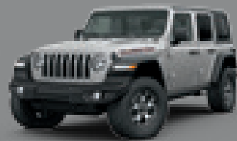
Billet Silver Metallic