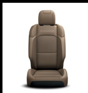
Sièges en tissu Heritage Tan avec logo 'Sahara'