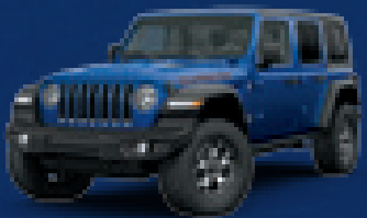
Ocean Blue Metallic