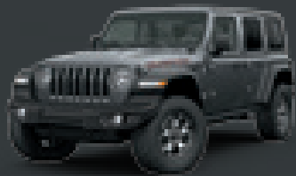
Granite Crystal Metallic