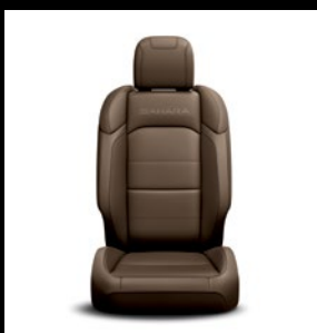
Sièges en cuir Dark Saddle avec logo 'Sahara'