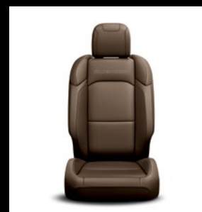
Sièges en cuir Dark Saddle avec logo 'Rubicon'