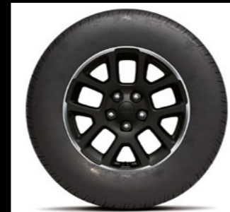
Overland 18 - 1M7