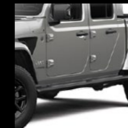
MOPAR zwarte buisvormige zijtreden