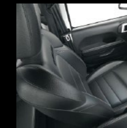
Mc Kinley premium lederen zetels (zwart)