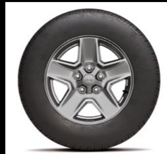
Sport 17 - 1M6