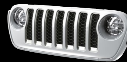
Silver Zynith Metallic