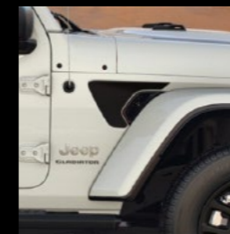
Freedom' vleugel decals