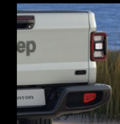
'FAROUT' Metalen plaatje op achterklep